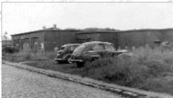
Schans nr. 8 in de toenmalige Floralei, circa 1950.