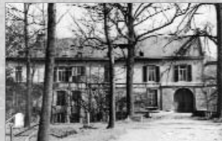
Kasteel Cantincrode, zuidgevel anno 1939.

In juli 1570 worden alle leengoederen van Cantecroy door koning Filips II in één graafschap verenigd. De jongere broer van de kardinaal, Thomas Perrenot de Granvelle, wordt de eerste graaf. Rond die periode worden onder leiding van de hertog van Alva verdere versterkingswerken uitgevoerd en groeit het kasteel uit tot een machtige vesting. Cantecroy was strategisch zeer belangrijk als laatste versterking vóór Antwerpen en als controlepunt voor de wegen van Antwerpen naar Lier en Mechelen.