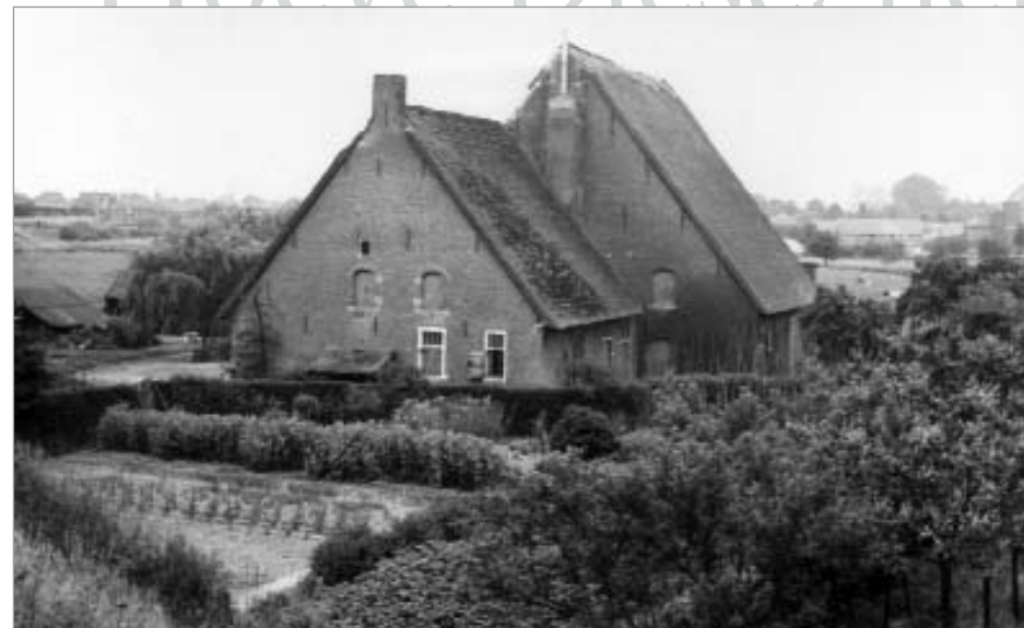
Hoeve Dieseghem in de jaren '50.

Op een zonnige zondag, 30 september 1979, ging het rieten dak en het dakgebinte in de vlammen op. Door besluiteloosheid bleef de hoeve bijna 15 jaar in de steigers staan, voorzien van een nooddak. Er gingen zelfs stemmen op om het Klasseringsbesluit in te trekken. Gelukkig ging dit niet door en door de bekomen subsidie voor noodherstelling en renovatie werd de hoeve gered en werd ze een onderdeel van de infrastructuur van het Cultureel Centrum. Op zaterdag 23 april 1994 werd Hoeve Dieseghem in gebruik genomen als vergader- en ontmoetingsruimte.