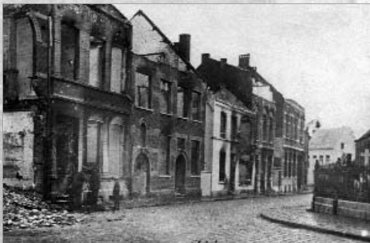
De Kerkstraat na beschietingen in 1914.

De oudste vermelding vinden we in 1609 toen een regiment krijgsvolk uit Diest in de straat in huizen binnendrong en vernielingen aanrichtte. Volgens de beschrijving van de tiendwijken loopt de straat langs de linkerzijde van de Iste en de Ilde wijk en de rechterzijde van de XVde