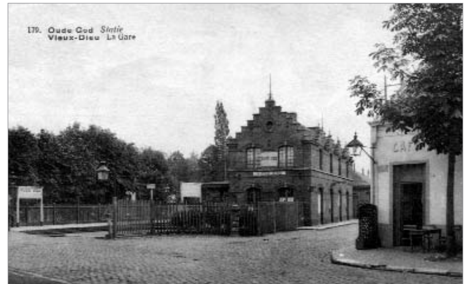
Station Oude-God. Circa 1920.

Mortsel werd reeds in de negentiende eeuw rijkelijk voorzien van spoorwegen en telde tot 1940 niet minder dan 5 stations. Hiervan blijven er nog drie over die operationeel zijn en één (aan de Lierseseenweg) dat dienst doet bij werken op de lijn 25 (Antwerpen-Brussel). Het station Luithagen, gelegen op het ringspoor rond Antwerpen is, samen met de rails, verdwenen. 'De Berm' naast de Krijgsbaan vormt nog steeds een groene verbinding door Mortsel.