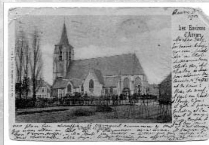
Sint-Benedictuskerk, anno 1901.

De parochiekerk van het oude Mortsel is toegewijd aan de patroonheilige van het oude klooster van Lobbes, eertijds de eigenaars van vele gronden in Mortsel (na een schenking van Sint-Reinhildis). De kerk werd voor het eerst vermeld in het midden van de 12 de eeuw tussen 1149 en 1159 als een onafhankelijke kerk, vermoedelijk in hout gebouwd. Tot in de 16 de eeuw had de abt het recht om de pastoor te benoemen. Later zou dat overgenomen worden door de Heren van Cantecroy.