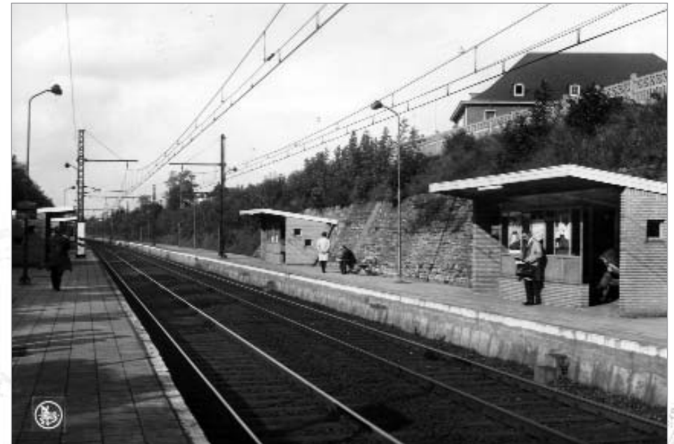
Station Mortsel Oude-God. Circa 1970.