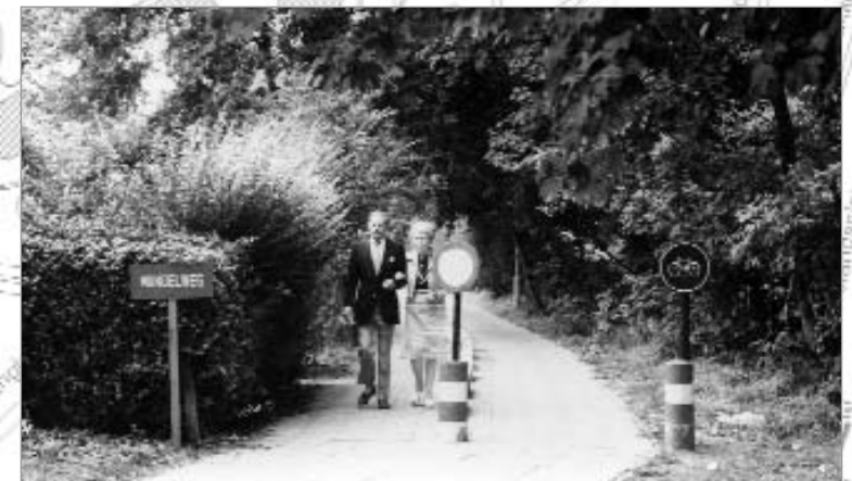
Begin wandelweg Grotenhof richting Eggestraat.

De wandelweg naar de Eggestraat loopt eveneens over een vroegere spoorbedding. Het was de aftakking van het ringspoor naar de lijn Antwerpen-Brussel. Deze bypass diende ook als bevoorradingspoor naar de mouterij in de Molenstraat. Er was ook nog een aftakking van de lijn Antwerpen-Brussel naar Edegem en Boom (de huidige Boniverlei in Edegem).