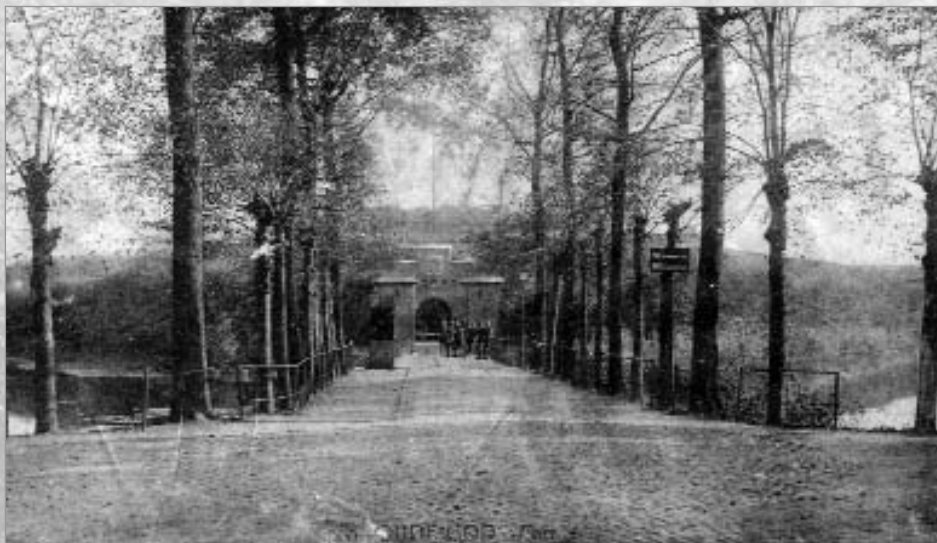
Brug FORT 4, anno 1920/1921.