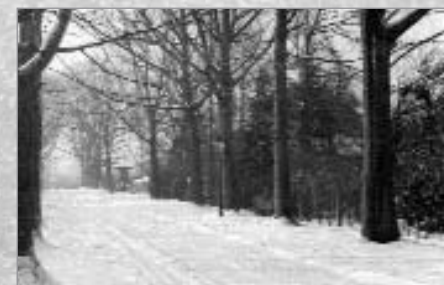
Ondergesneeuwde Quinten Matsijslei in december 1950.