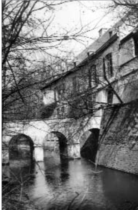
Kasteel Cantincrode, oostzijde anno 1939.