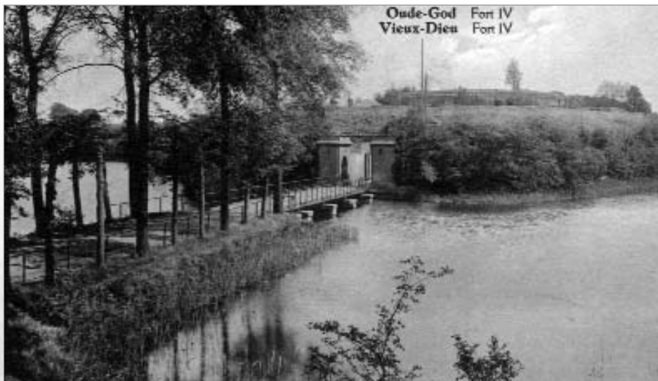
Brug aan FORT 4, anno 1928.