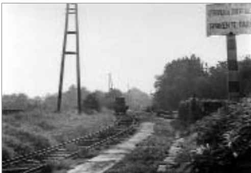
Het bevoorradingspoot vanuit Eggestraat richting station Luithagen. Circa 1950.