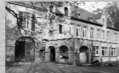
Kasteel Cantincrode, noordgevel anno 1939.