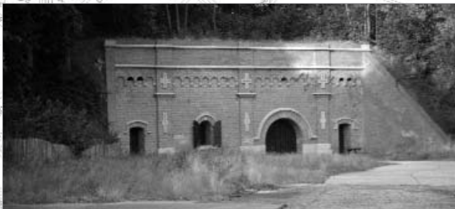
Rechter halve caponnière, 2007.

Rechts voor ons zien we de gevel van de 'rechter halve caponnière'. Deze vreemde naam komt, zoals de meeste termen i.v.m. verdedigingswerken uit het Italiaans, omdat de Italianen de uitvinders waren van verdedigingswerken tegen geschut.