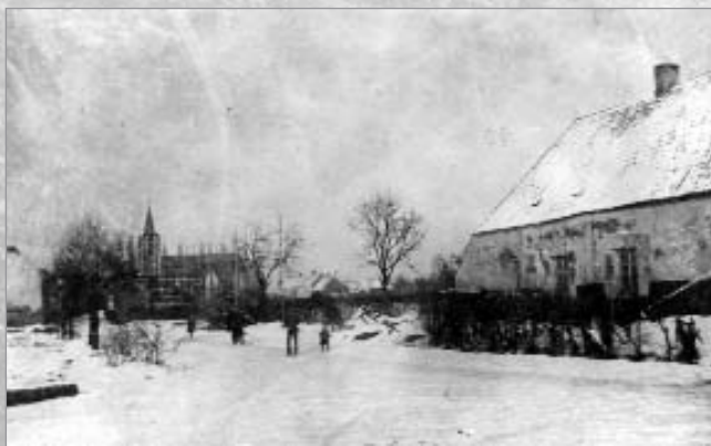
Wouwstraat in 1902: we zien de hoeve van Gommerus Van Den Broeck in de Wouwstraat tegenover de Groenstraat. De boerderij werd gesloopt in 1931 bij aanleg van het dieptespoor. Op deze plaats bevindt zich nu de brug.

In 1869 begon men deze onverharde weg te kasseien. In 1870 was het werk voltooid.