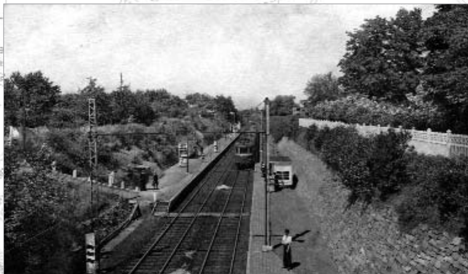
Nog niet overdekt station Oude-God (dieptsespoor). Circa 1950.