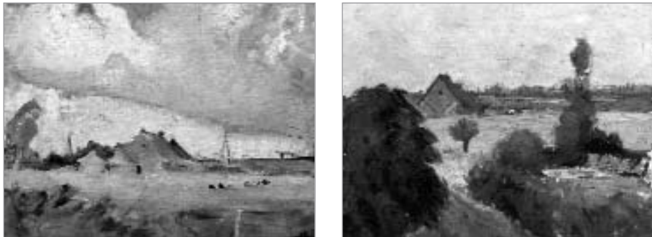
Schilderijen van Hoeve Dieseghem van Lode IVO, 1942.