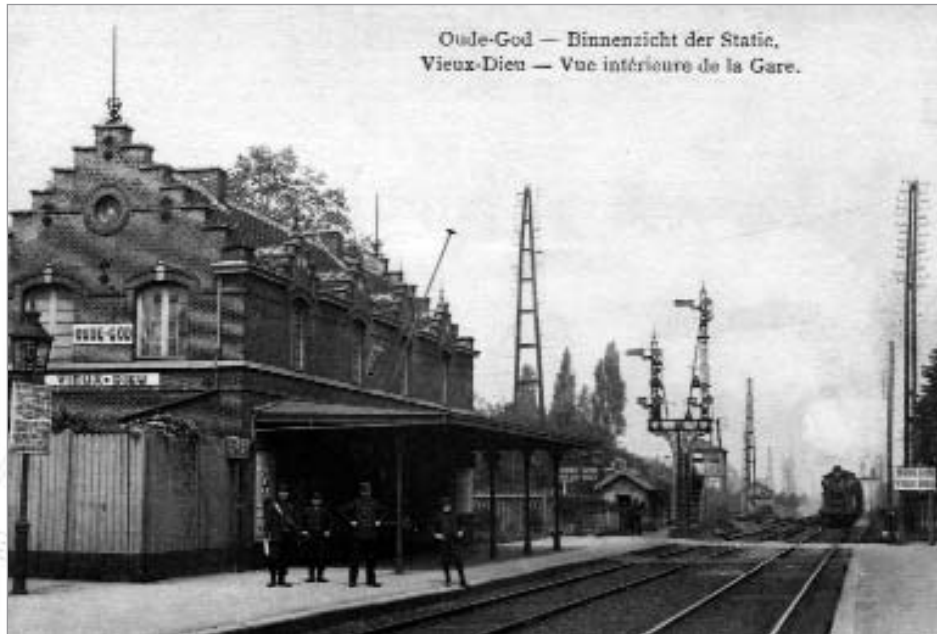
Oorspronkelijk bovengronds station Oude-God. Circa 1920.