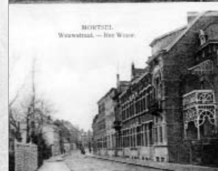
Oude postkaart met twee zichten van de Wouwstraat.