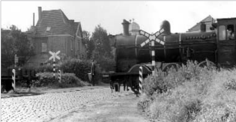
Spoorwegovergang achteraan de Eggestraat. Circa 1950.

De straat begon aan het kruispunt van de huidige Dieseghemlei en Osylei. De weg staat als 'chemin n° 1' op de Atlas van de Buurtwegen beginnende 'aen den steenweg van Antwerpen naer Lier'. Aan de huidige Osylei splitste de weg, één weg ('Chemin n° 10') liep verder in de richting van het gehucht Waesdonck en verder naar Deurne. De andere tak ging hier naar rechts in de richting van Borsbeek.